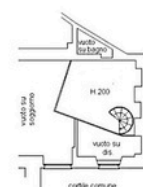
Piano TERRA/ Soppalco