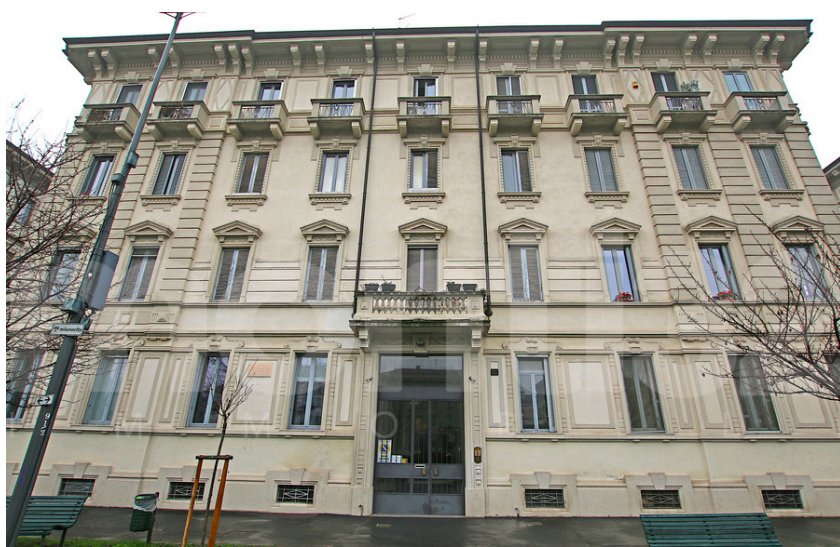
Piazzale Giulio Cesare – CityLife

Scopri questo luminoso e silenzioso appartamento di 100 mq, caratterizzato da una tripla esposizione che inonda gli spazi di luce naturale. Situato in una delle zone residenziali più ambite della città, all'interno di un affascinante palazzo d'epoca dei primi del '900 dotato di ascensore, questo immobile è un vero gioiello.